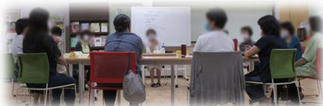
親のホットひろば「おしゃべり会」