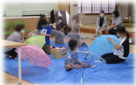
9月のわくわく工房「かさでアートを楽しもう」

ボランティア募集について： 募集中です。活動に参加してみたい方はあべのボランティア活動センターにお問い合わせください。