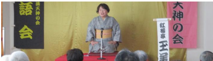
2/28(水) お楽しみ落語会