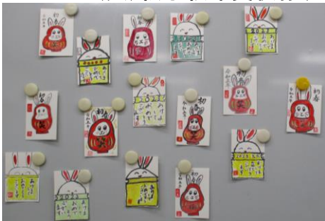
11/22(火) 絵手紙年賀状作り