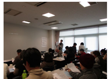
昨年度の講座の様子

主催：ボランティアグループ「竹の子」 NPOあべのひまわり（阿倍野ひまわり作業所・茶来） 阿倍野区保健福祉センター 阿倍野区社会福祉協議会