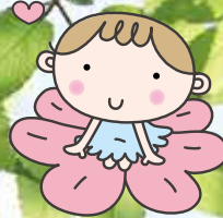
阿倍野区社協 マスコット キャラクター あいちゃん

誰もが住みたい・住み続けたいまち —— 「あべの」 ともに“見守りの輪”を広げていきませんか。 企業・団体のみなさま、ぜひご協力を!