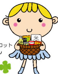
あべの区社協マスコット あいちゃん

◇今後とも、この活動にご協力いただける方は、阿倍野区社会福祉協議会にご連絡ください。みんなで支え合える地域にしていくため、皆様のご協力をよろしくお願いいたします。